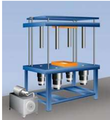
Entnahmeposition: Die Stangen sind aus dem Weg. Für noch mehr Platz könnten sie zusätzlich noch nach oben weggezogen werden.