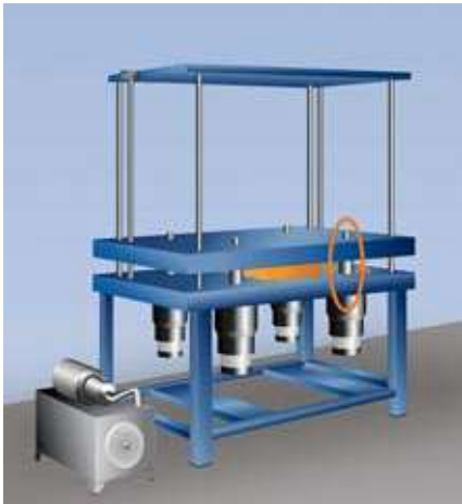
Arbeitsposition: Kraftfluss findet nur im Bereich der Form statt.